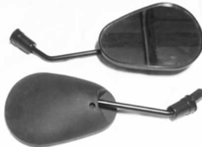
Descripción: ESPEJO PAN SCOOTER 125 NEGRO 8MM UM: PAR Código: CHN0017213