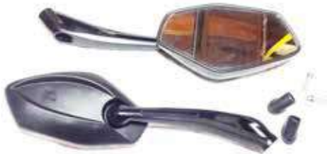
Descripción: ESPEJO PAN. KEEWAY-TX/ALUM-10MM UM: PAR Código: CHN0016868