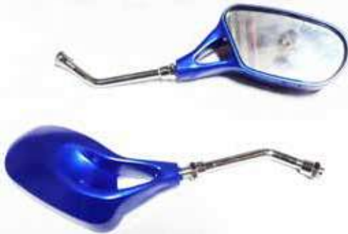
Descripción: ESPEJO PAN. URBANO 2 PIEZ. AZUL 10MM UM: PAR Código: CHN0016808