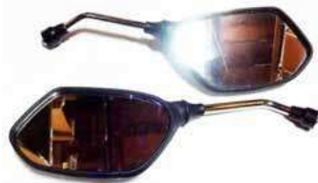
Descripción: ESPEJO PAN. UNICRON CROMO 10MM 88110/20-E05-00 UM: PAR Código: CHN0017572