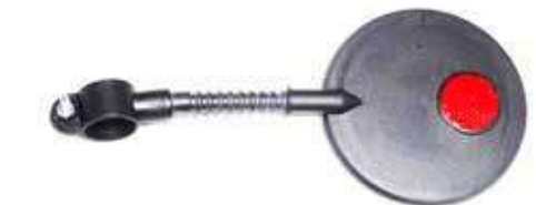
Descripción: ESPEJOS BICI C/REFLECTOR CL/129 UM: PZA Código: CHN0007121