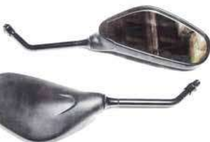
Descripción: ESPEJO GY NEG 10MM 88110/20-070-00FJ UM: PAR Código: CHN0012845