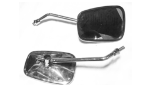
Descripción: ESPEJO 88110/20-56B-00 UM: PAR Código: CHN0008131