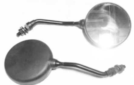
Descripción: ESPEJO PAN. TORITO BAJ. PAR 88110/20-E04-000 UM: PAR Código: CHN0017483