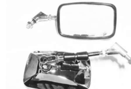
Descripción: ESPEJO DER/IZQ 88110/20-150-00 UM: PAR Código: CHN0006985