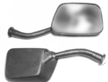
Descripción: ESPEJO 88110/20-MIB-REC UM: PAR Código: CHN0029883