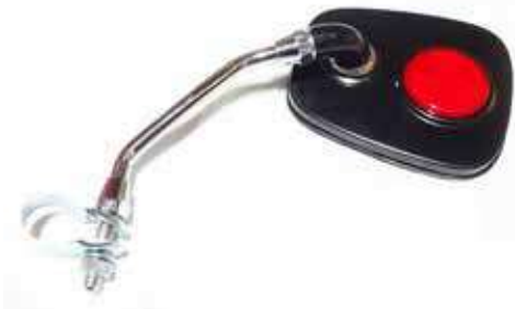
Descripción: ESPEJOS B. C/REFLEC CL-106 OVAL UM: PZA Código: TWN0003146