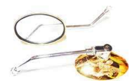
Descripción: ESPEJO 10MM C/BRAZO LARGO DORADO UM: PAR Código: CHN0008421