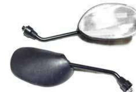
Descripción: ESPEJO WAVE 10MM 88110/20-30T-00 UM: PAR Código: CHN0007440