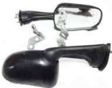
Descripción: ESPEJOO DERE/IZQ. 88110/20/50S-000 FJ UM: PAR Código: CHN0011728