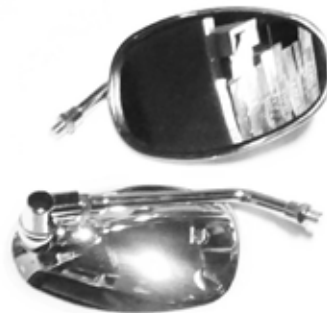
Descripción: ESPEJOS PAN. CARGUERO CROM.10MM UM: PAR Código: CHN0010457