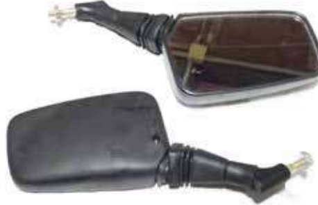
Descripción: ESPEJOS ACORDION 8MM FA-46 8MM UM: PAR Código: CHN0009309