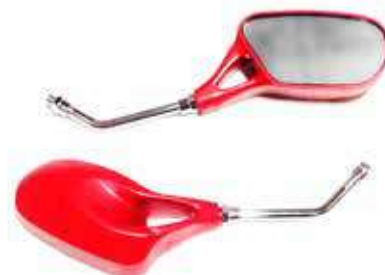
Descripción: ESPEJO PAN URBANO 2PIEZ. ROJO 10MM UM: PAR Código: CHN0016807