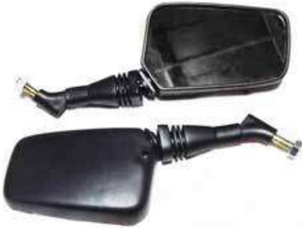
Descripción: ESPEJO ACORD. LARGO FA-46 10MM UM: PAR Código: CHN0009308