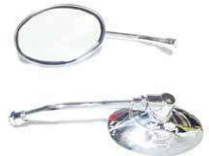
Descripción: ESPEJO 10MM C/BRAZO CORTO CROMADO UM: PAR Código: CHN0012250