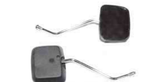
Descripción: ESPEJO CGL-10MM 88110/20-57A/D-00 UM: PAR Código: CHN0008442