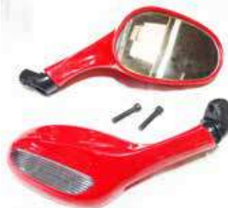
Descripción: ESPEJO 88110/20-50T-0RJ FJ UM: PAR Código: CHN0012846