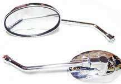
Descripción: ESPEJO 10MM C/BRAZO LARGO 88110/20-00 CP UM: PAR Código: CHN0011763