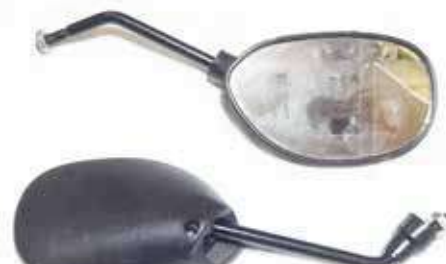
Descripción: ESPEJO DER/IZQ 8MM 88110/20-30T-000 UM: PAR Código: CHN0016440