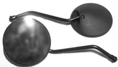
Descripción: ESPEJO BROSS/RE- DONDO NEG. 10MM Código: CHN0013563