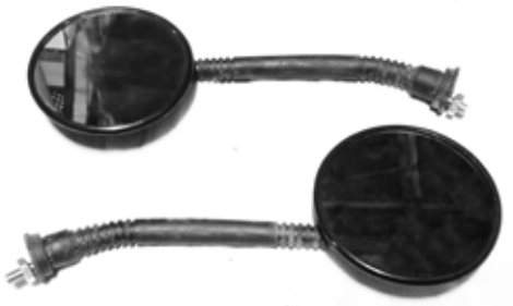
Descripción: ESPEJO ACOR. REDONDO NEGRO8MM UM: PAR Código: TWN0006492