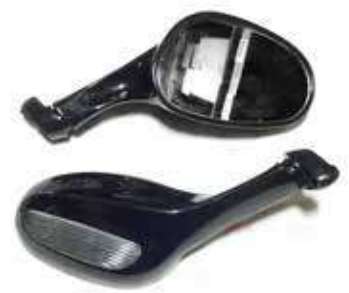
Descripción: ESPEJO 88110/20-50T-ONE FJ UM: PAR Código: CHN0012847