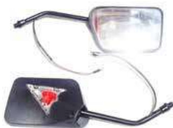
Descripción: ESPEJO PAN. C/DIR. STORM/WX 10MM UM: PAR Código: CHN0016805