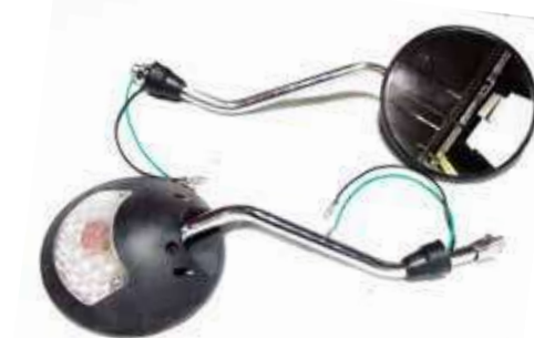
Descripción: ESPEJO C/DIR. CG 10MM 881110/20-KYO-00 UM: PAR Código: CHN0007490