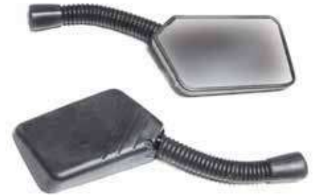
Descripción: ESPEJO MINI-STORN 10MM 88110/20-BLK-001 UM: PAR Código: CHN0016810