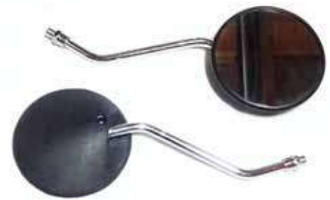
Descripción: ESPEJO CG/CB CROM. 10MM 88110-397-000 UM: PAR Código: CHN0009319