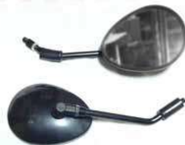
Descripción: ESPEJO PA. HARLEY NEGRO 10MM 88110/20-E02-000 UM: PAR Código: CHN0016804