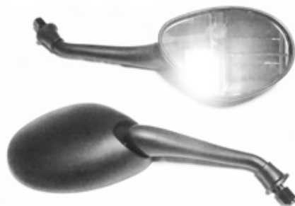
Descripción: ESPEJO PAN PULSAR PLAST 10MM 88110/20-SOB-000 MIB UM: PAR Código: CHN0016474