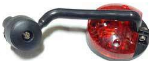
Descripción: ESPEJO CON LUZ BM-6003 UM: PZA Código: CHN0023998