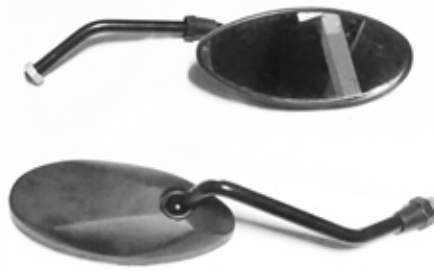
Descripción: ESPEJO PAN. ELIPSE 10MM 88110/20-BLK-151 UM: PAR Código: CHN0016809