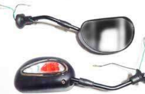
Descripción: ESPEJO C/DIR.WAVE 10MM 88110/20-14B-00 UM: PAR Código: CHN0007273