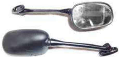
Descripción: ESPEJO 80110/20-NOV-000 UM: PAR Código: CHN0019653