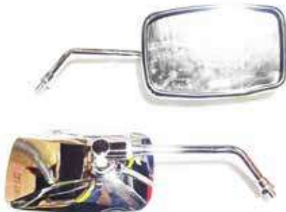
Descripción: ESPEJO BRAZO CURVO 88110/20-150-00 UM: PAR Código: CHN0016351