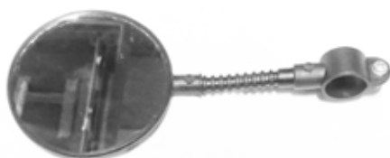
Descripción: ESPEJO BM-6001 UM: PZA Código: CHN0023997