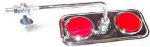
Descripción: ESPEJO MTB 2/ REFLECTORES CL-102 CP LARGO UM: SET Código: TWN0004609