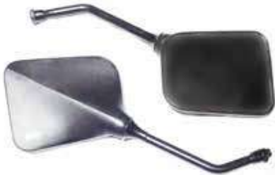
Descripción: ESPEJO DER/IZQU. 88110/20-52C UM: PAR Código: CHN0010065