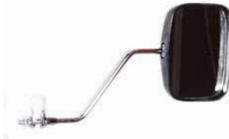
Descripción: ESPEJOS MTB NEGRO RECTAN CL-122 UM: PZA Código: TWN0004205