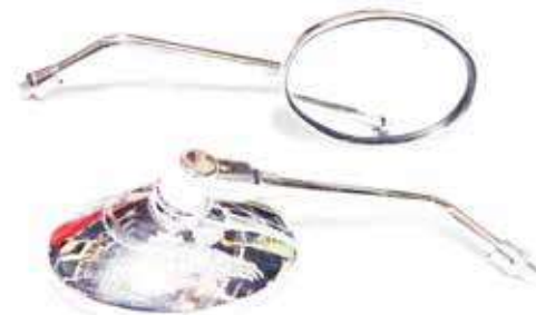
Descripción: ESPEJO 10MM C/BRAZO MEDIA 88110/20-000 CP UM: PAR Código: CHN0011315