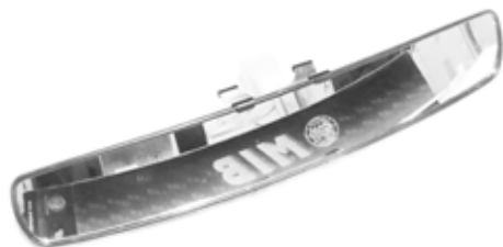
Descripción: ESPEJO RETROVISOR /43CM LARG. 88110/20-E03-000 UM: PZA Código: CHN0016471