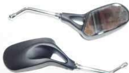
Descripción: ESPEJO PAN. URBANO 2 PIEZ. NEGR. 10MM UM: PAR Código: CHN0016806