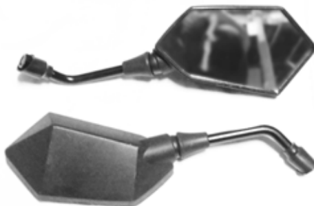
Descripción: ESPEJO PAN WX200- GY/MURCI 10MM MIB DIAMOND UM: PAR Código: CHN0016803