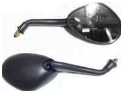
Descripción: ESPEJO PAN. PULS. PLAST. 8MM 88110/20-E01-000 UM: PAR Código: CHN0016472