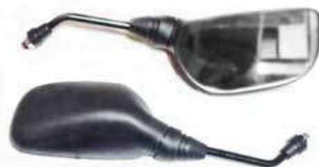
Descripción: ESPEJO PANJ PULSAR 10MM 88110/20-PUL-000 UM: PAR Código: CHN0016473